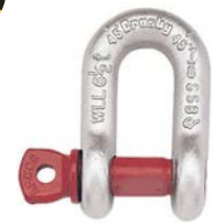
G-210 / S-210

G-210 Los grilletes de perno roscado para cadena cumplen la Especificación Federal RR-C-271F, Tipo IVB, Grado A, Clase 2, excepto por las estipulaciones exigidas del contratista. Para mayores informaciones vea la página 444.